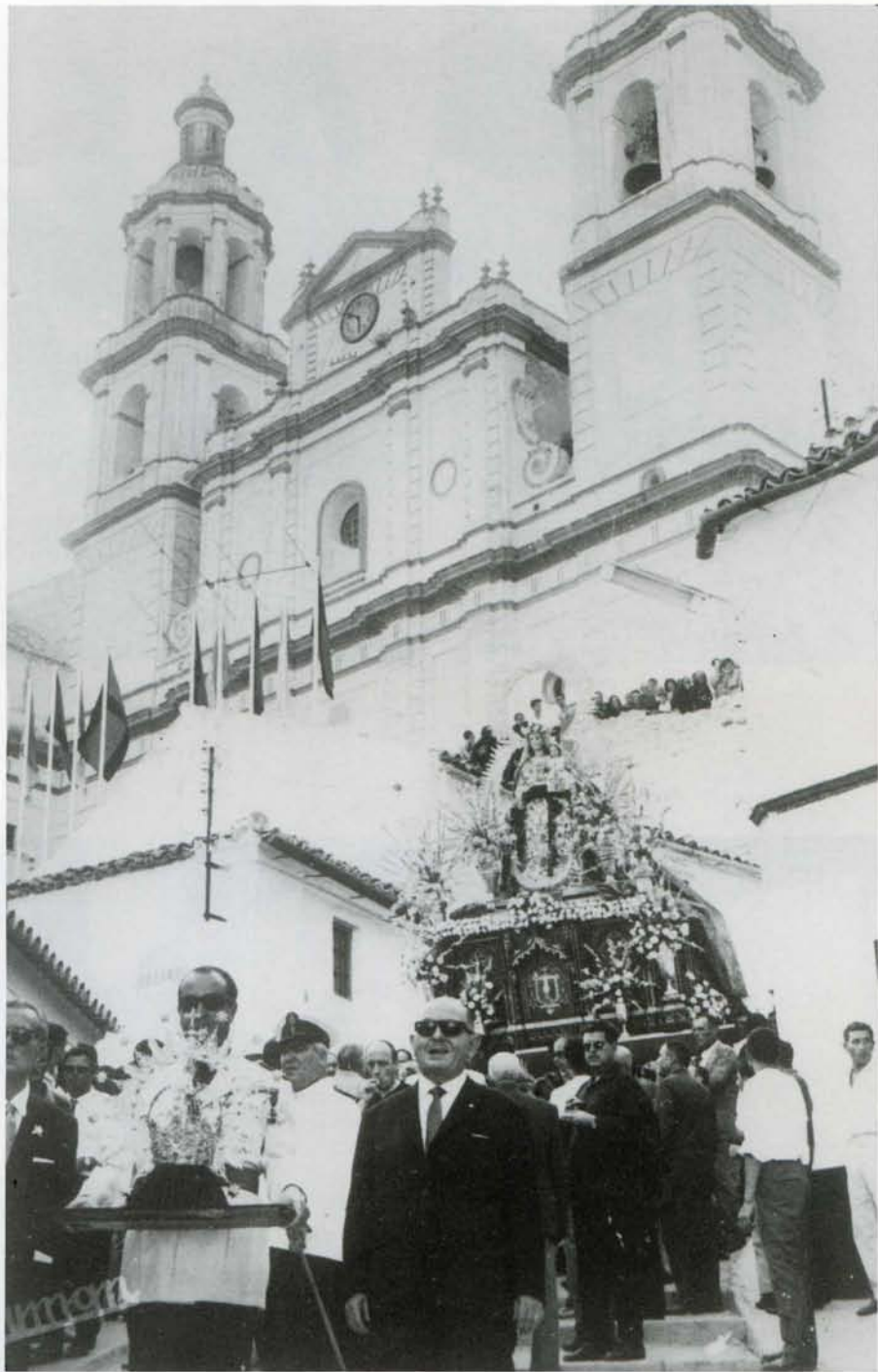
Coronación Canónica de Ntra. Sra. de los Remedios 15 - Agosto - 1966.