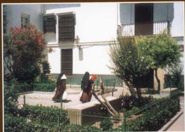
CONVENTO DE SANLÚCAR FUNDADO POR SOR ÁNGELA DE LA CRUZ