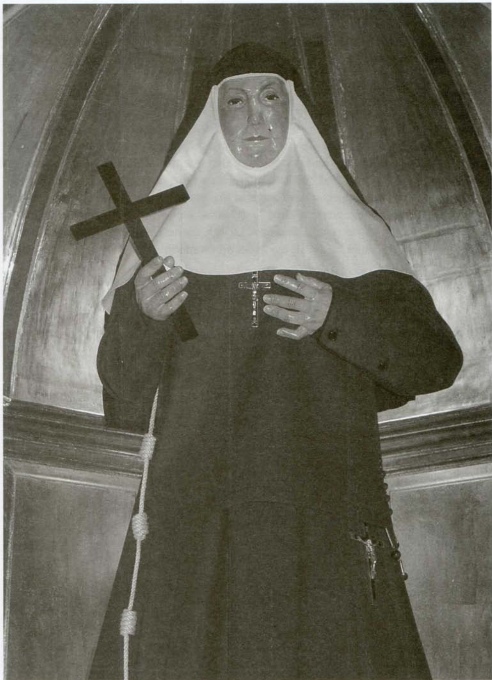
IMAGEN DE SANTA ÁNGELA DE LA CRUZ DE LA HERMANDAD DE LA ESPERANZA QUE LA TIENE COMO COTITULAR.