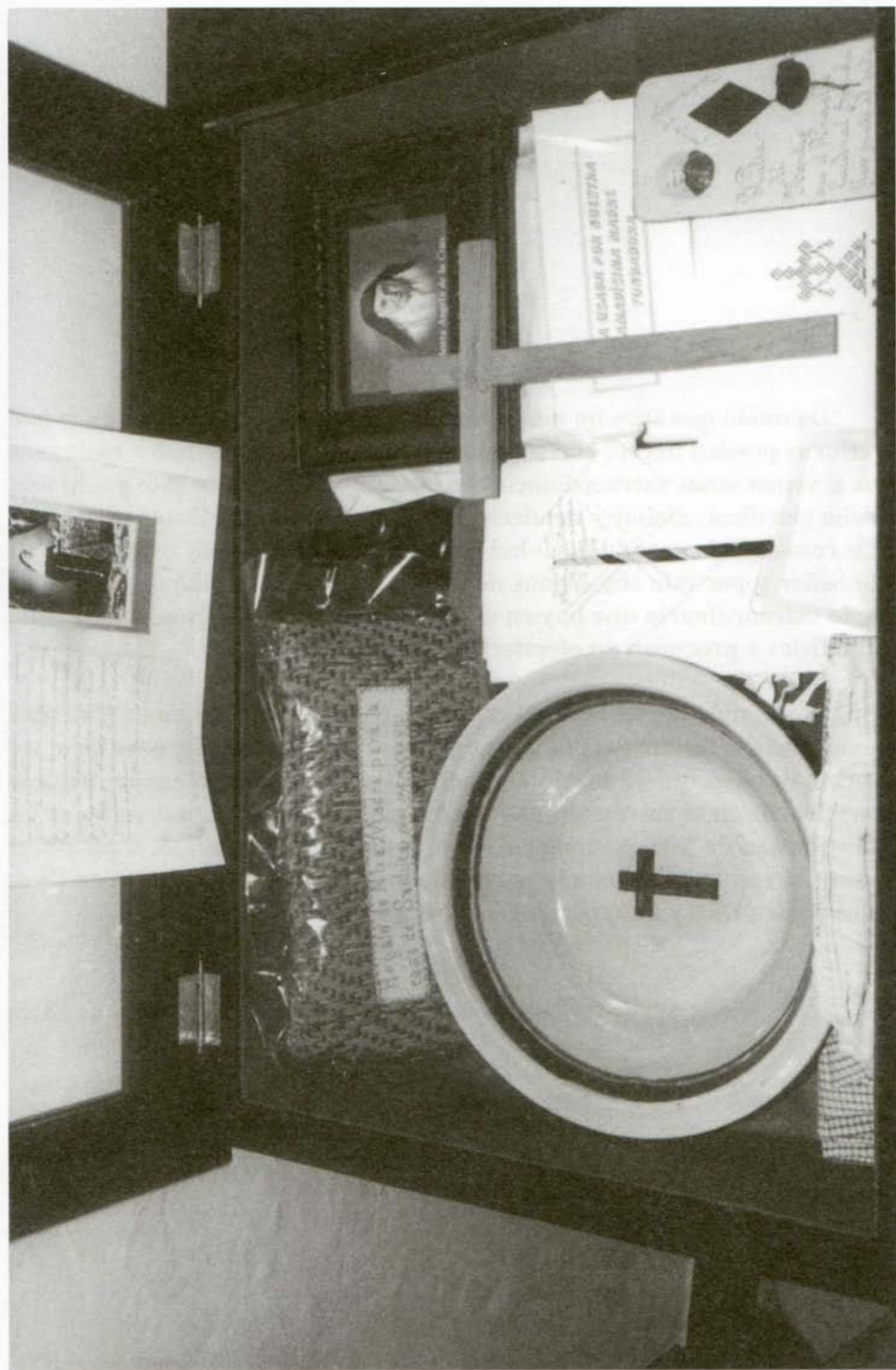
ENSERES PARTICULARES USADOS POR SANTA ÁNGELA DE LA CRUZ Y QUE SE CONSERVAN COMO RELIQUIAS EN EL CONVENTO DE SANLÚCAR